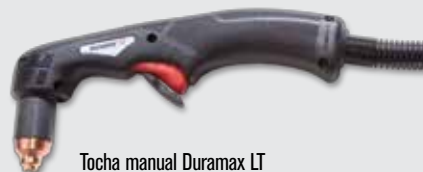
Tocha manual Duramax LT